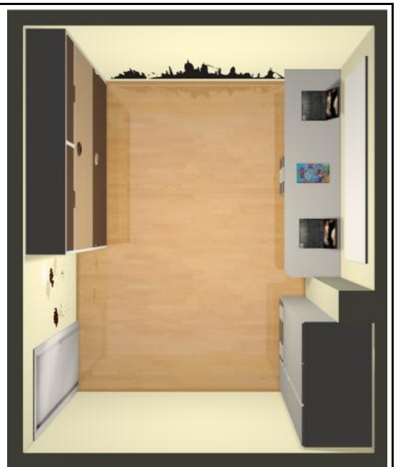
Perspectiva y vista de pájaro realizadas de acuerdo a las medidas y colores solicitados

¡Sorprende a tus amig@s con tú creatividad, tú buen gusto y tú imaginación!