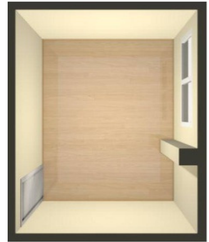
Habitación para amueblar